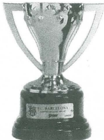
COPA DE LLIGA