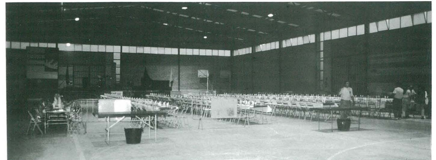
Aspecte de la preparació de la Festa