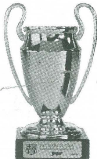
COPA DE EUROPA