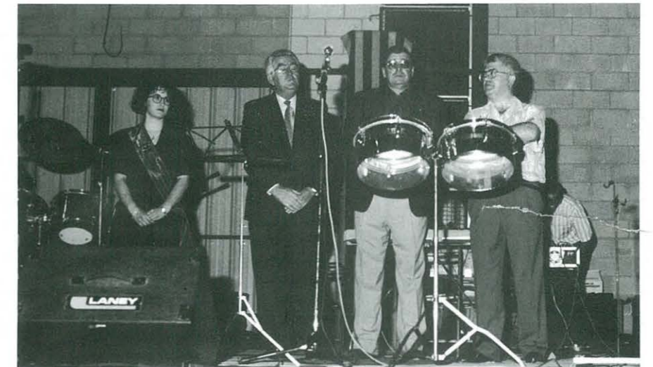
Parlaments (d'esquerra a dreta) la Pubilla 93, el Delegat del Barça, el President de la Penya i el Batlle d'Ulldecona

Després, i per primera vegada, l'emotiu homenatge als socis que han superat els 82 anys, se'ls oferí un quadre, a cadascú, amb l'inscripció: