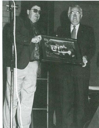
Intercanvi d'obsequis entre el Barça i La Penya

El passat 28 de maig, dissabte, vam celebrar la festa que com cada any, organitza la Penya Barçelonica per als seus socis, aquesta, era la segona vegada que no es feia a l'Ermida com era típic, perquè la cabuda d'aquesta es va quedar petita per a tots els socis que anem. Ja l'any passat vam celebrar-ho al Pavelló Municipal i